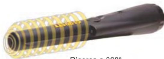
Ricerca a 360°