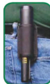
PortaPro-Pointer da cintura INCLUSO