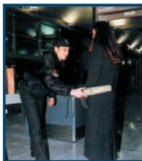
Aeroporti americani ed internazionali